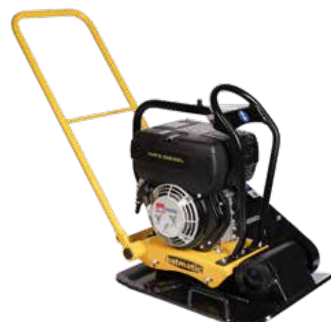
FP2150 R diesel