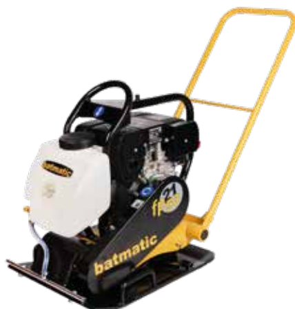
FP2150 W diesel

Leva acceleratore con posizioni fisse, per garantire produttività e affidabilità nel tempo (modello diesel).