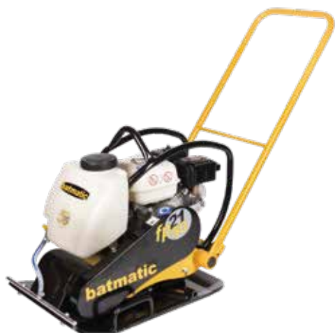
FP2150 W benzina