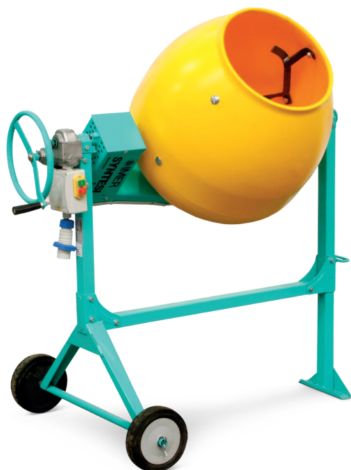
Syntesi 140 HDPE